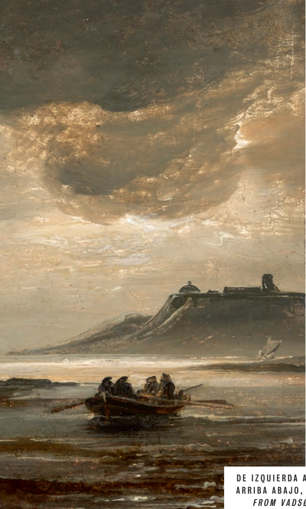
DE IZQUIERDA A DERECHA, DE ARRIBA ABAJO, PEDER BALKE: FROM VADSØ , H. 1840. LARS HERTERVIG: OLD PINE TREES , 1865. EUGENIO LUCAS VELÁZQUEZ: UN TORREÓN EN RUINAS , 1853