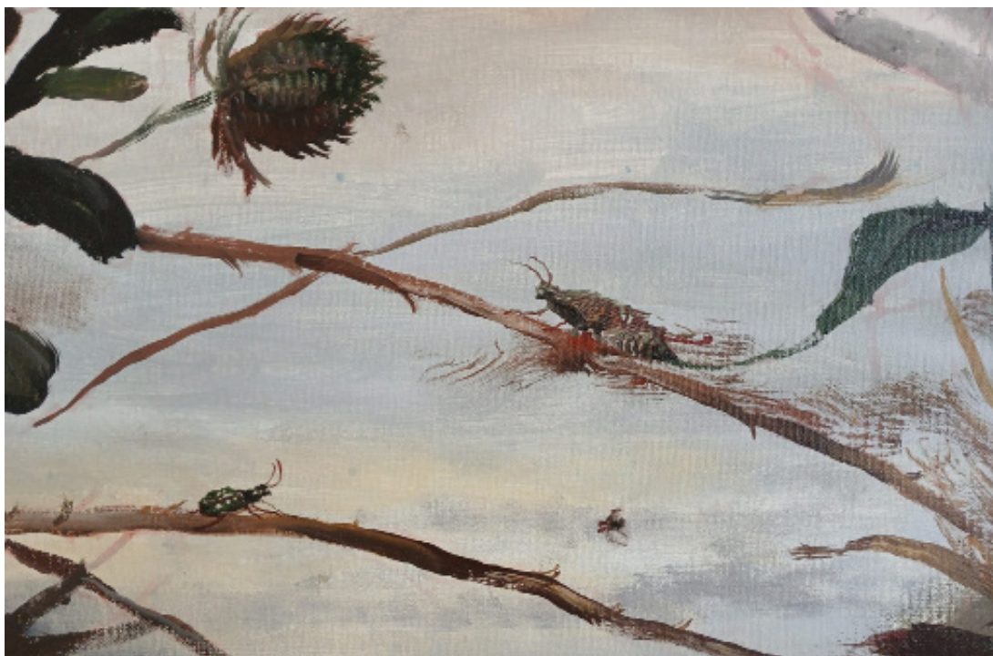
500 años de paseo por el parque, (detalle) Íñigo Navarro, 2025

comunicacion@museolazaro galdiano.es +34 91 561 60 84