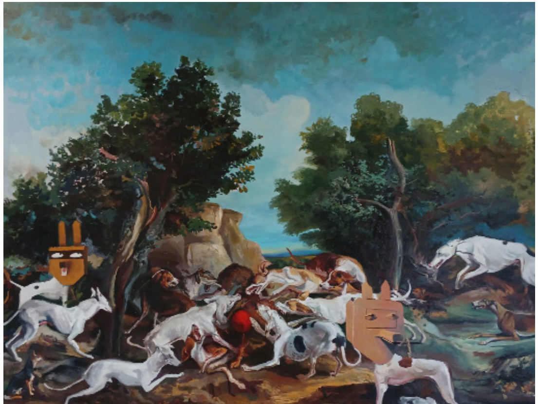
Dos intrusos fuera de Beirut Íñigo Navarro, 2025

comunicacion@museolazaro galdiano.es +34 91 561 60 84