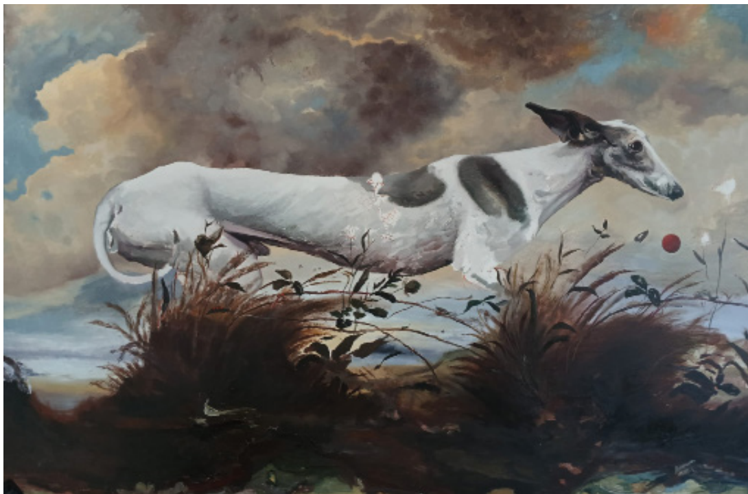
500 años de paseo por el parque Íñigo Navarro, 2025