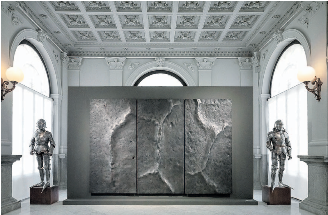
Escultura de la serie 'Viciny' (2018), instalada en la Sala Pórtico del museo madrileño. AITOR ORTIZ